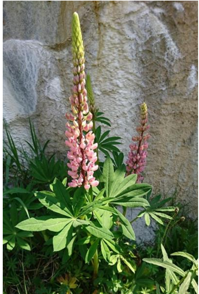
Lupinus polyphyllus