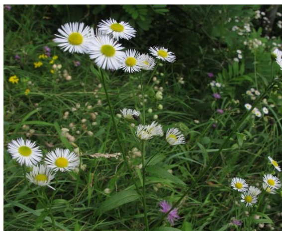
Erigeron annuus